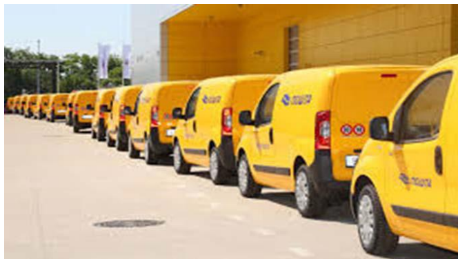
Slika 3. Korištenje vozila za potrebe prijena pošanskih pošiljka