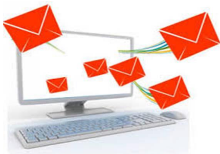
Slika 1. Tehnološke novine i primjena interneta u poštanskom sektoru

aktuelniji i zahtjeva novi prilaz, posebno danas u vrijeme uvođenja novih tehnologija elektronske trgovine. Od velikog je značaja za poštanski sektor u BiH je da iznađe svoj strateški put integracije interneta i naprednih tehnoloških rješenja, kroz usklađenost održivosti i zaštite okoliša.