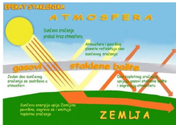
Slika 2. Efekat staklene bašte

Sama Konceptija društvenog marketinga poziva sve uključene pojedince i organizacije da pažljivo razmatraju društvene i etičke aspekte svoje poslovne prakse. Pouzdanost i sigurnost usluga, zahtjeva i očekivanja korisnika poštanskih usluga, fleksibilnost (sposobnost brzog prilagođavanja promjenama na tržištu i okruženju u kome posluje samo preduzeće) u skladu sa ekološkim ciljevima, kao i bitna obilježja koja ističu potrebu za zajedničkim analiziranjem promjene okruženja i istraživanje načina za izgradnju dinamične globalne infrastrukture sposobne da zadovolji potrebe korisnika u poštanskom sektoru.