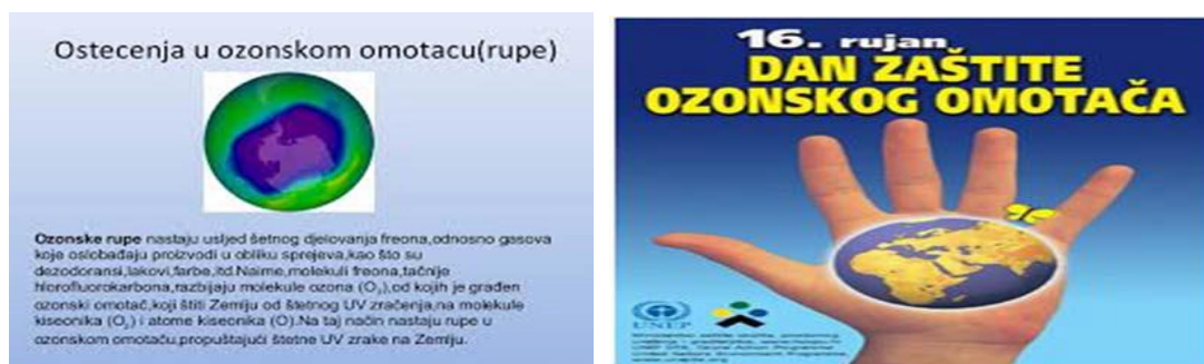
Slika 4. Izdavanje poštanske marke koje promovišu zaštitu okoline